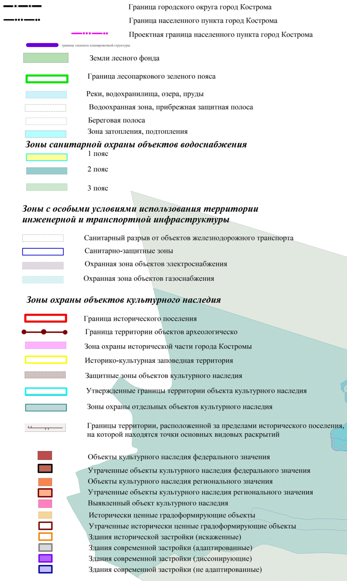
Схема границ территорий объектов культурного наследия. М 1:10 000.