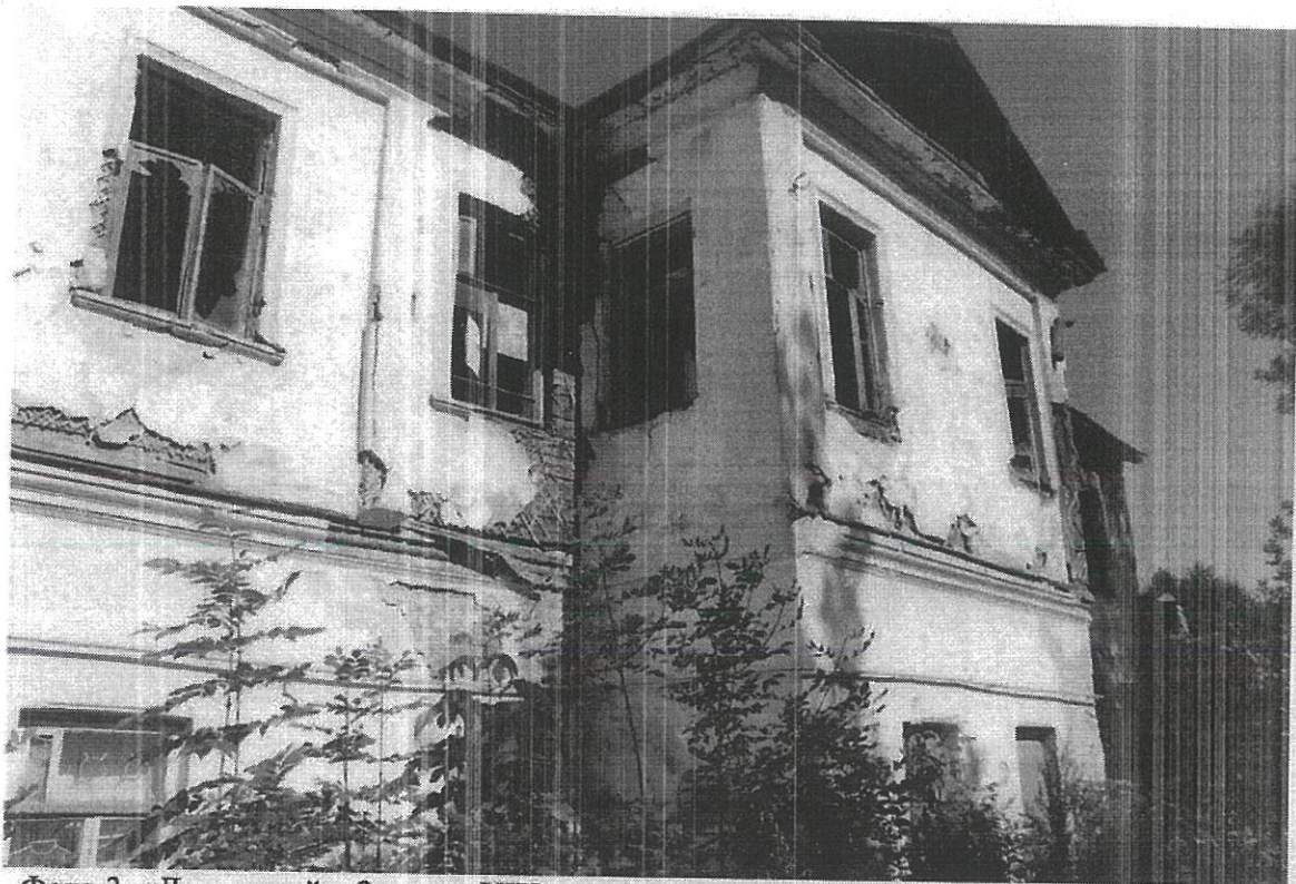
Фото 3. «Дом жилой», 2-я пол. XIX в., местоположение: г. Кострома, ул. Кооперации, д.2/15, лит.Б. Вид со стороны дворового (юго-западного) фасада.