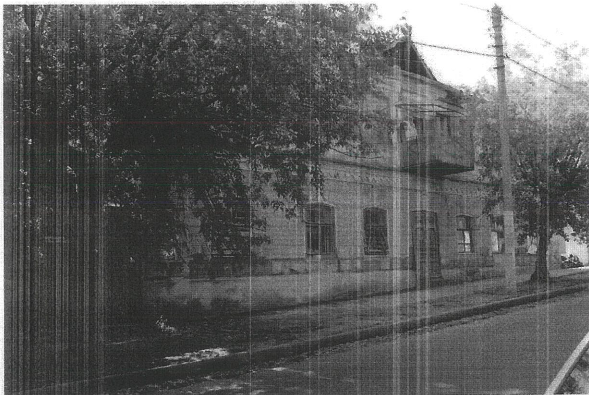
Фото 1. «Дом жилой», 2-я пол. XIX в., местоположение: г. Кострома, ул. Кооперации, д.2/15, лит.Б. Вид со стороны главного (северо-восточного) фасада.

Приложение к охранному обязательству собственника или иного законного владельца объекта культурного наследия регионального значения, включенного в единый государственный реестр объектов культурного наследия (памятников истории и культуры) народов РФ