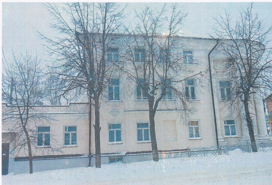
Фото 2. Вид со стороны улицы Крестьянской (восточный фасад)