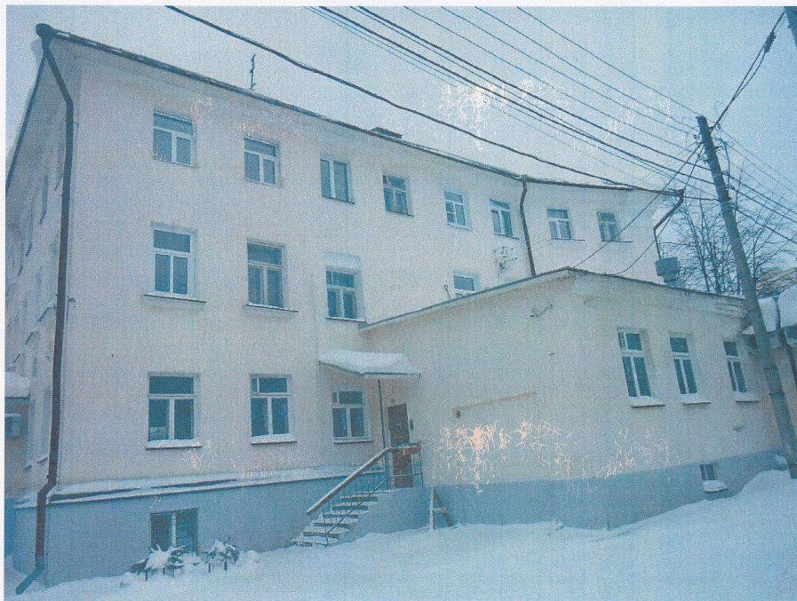
Фото 3 Дворовый (южный) фасад