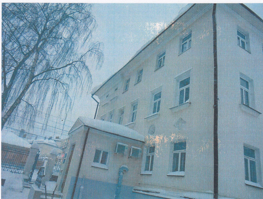
Фото 4 Боковой (западный) фасад