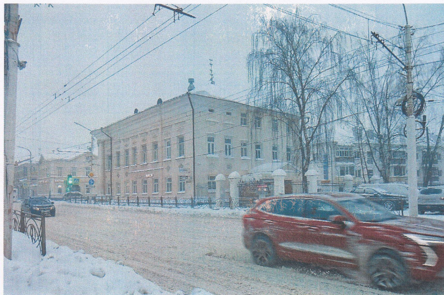
Фото 1. Общий вид со стороны ул. Советской, главный (северный) фасад

Приложение №1 к охранному обязательству собственника или иного законного владельца объекта культурного наследия регионального значения, включенного в единый государственный реестр объектов культурного наследия (памятников истории и культуры) народов Российской Федерации, утверждённому приказом Охранкультуры Костромской области от « 11 » 03 , 2024 № 20