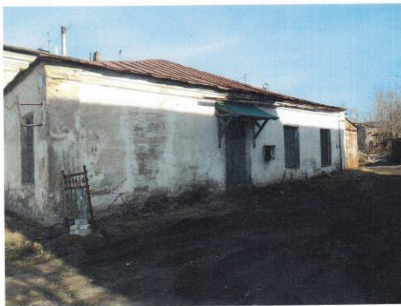
Фото 2. Вид со стороны бокового (юго-восточного) фасада