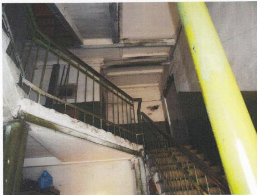
Фрагмент внутреннего помещения общего пользования (лестница)