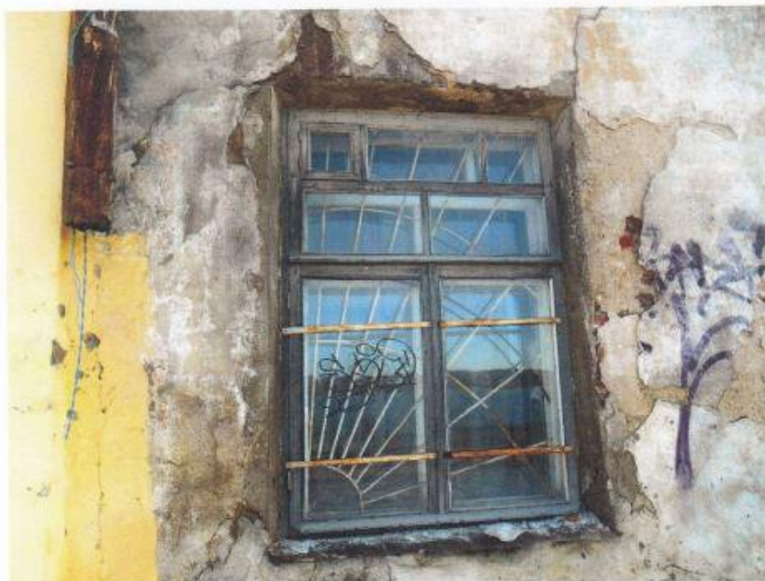
Фрагмент оконного заполнения