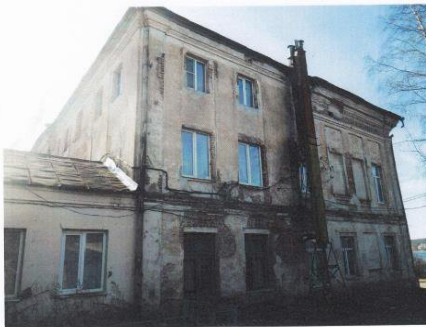
Фото 4. Вид со стороны бокового (северо-западного) фасада