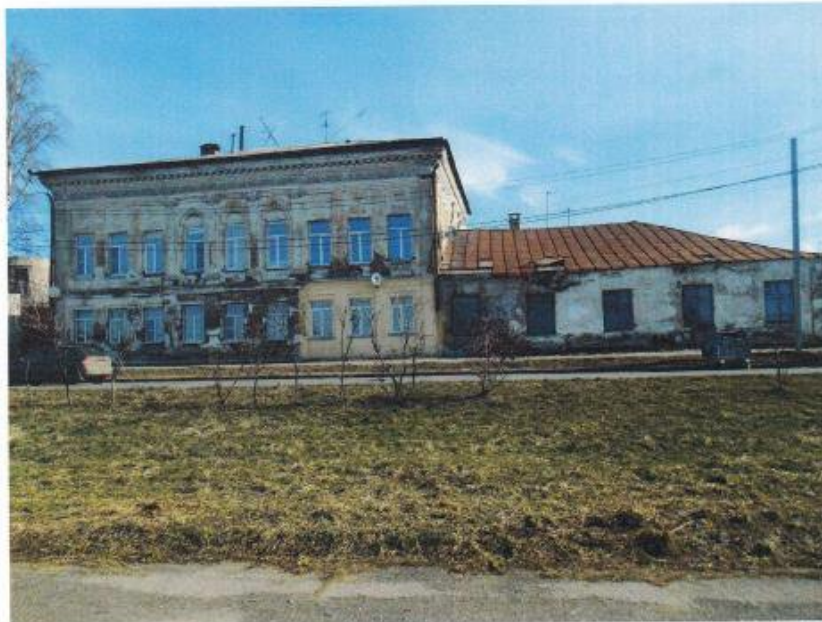
Фото 1. Вид со стороны главного (юго-западного) фасада

Приложение №1 к охранному обязательству собственника или иного законного владельца объекта культурного наследия регионального значения, включенного в единый государственный реестр объектов культурного наследия (памятников истории и культуры) народов Российской Федерации, утверждённому приказом Охранкультуры Костромской области от « 14 » апреля 2020 № 51