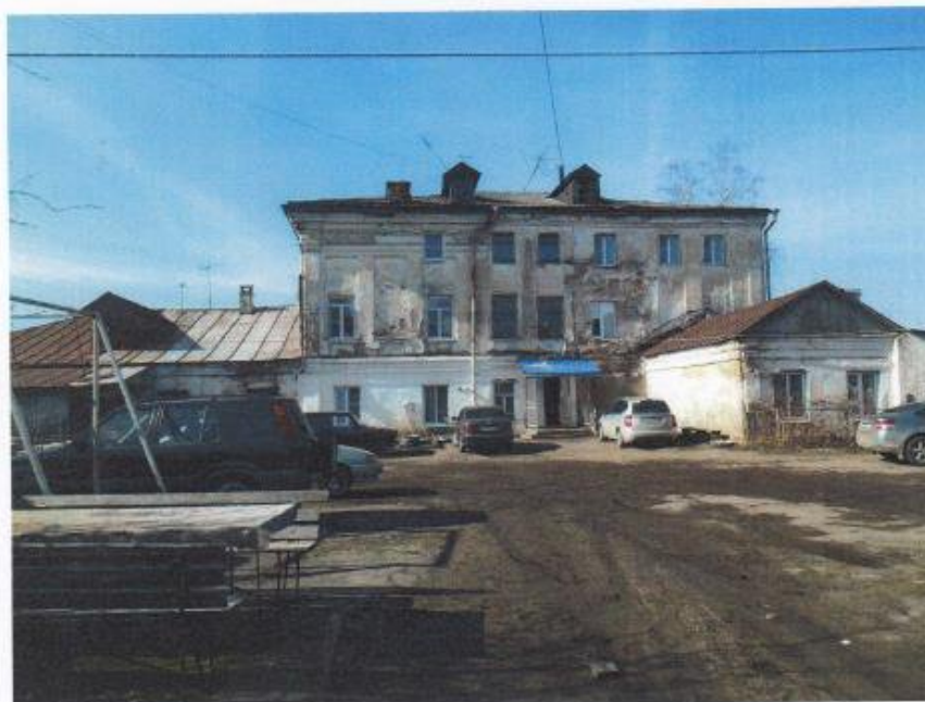
Фото 3. Вид со стороны дворового (северо-восточного) фасада