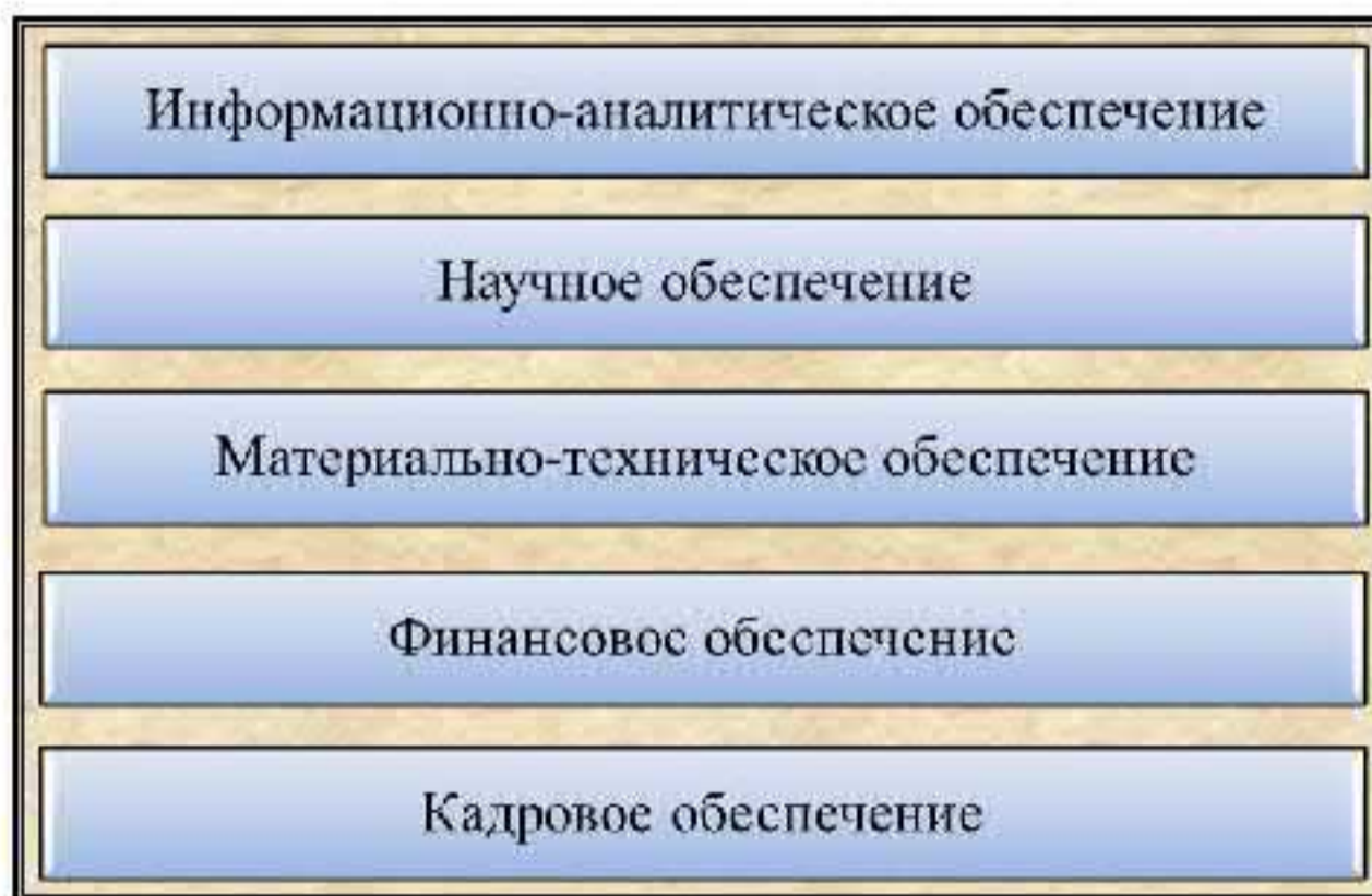
Рис. 7. Структура ресурсного обеспечения ОГСПТ

Эффективное решение задач по противодействию терроризму на общегосударственном уровне требует надлежащего ресурсного обеспечения деятельности ОГСПТ, в т. ч. информационно-аналитического, научного, материально-технического, финансового и кадрового (рис. 7).