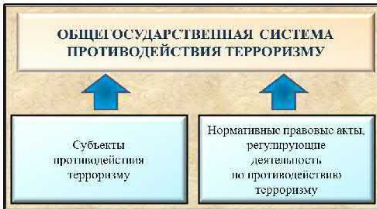
Рис. 5. Общегосударственная система противодействия терроризму

Согласно п. 5 Концепции противодействия терроризму в Российской Федерации (далее – Концепция) ОГСПТ представляет собой совокупность субъектов противодействия терроризму и нормативных правовых актов, регулирующих их деятельность по выявлению, предупреждению (профилактике), пресечению, раскрытию и расследованию террористической деятельности, минимизации и (или) ликвидации последствий проявлений терроризма (рис. 5).