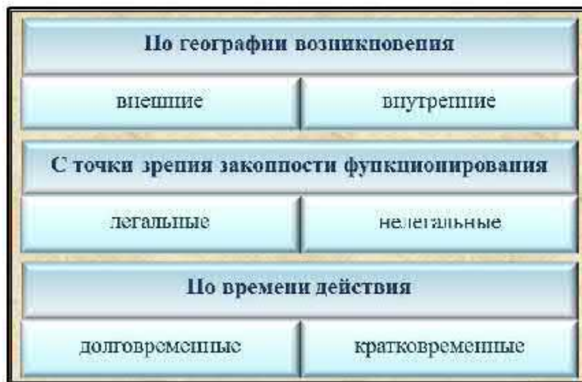
Рис.3. Классификация источников финансирования терроризма

Основными методами финансирования субъектов террористической деятельности на территории России являются: