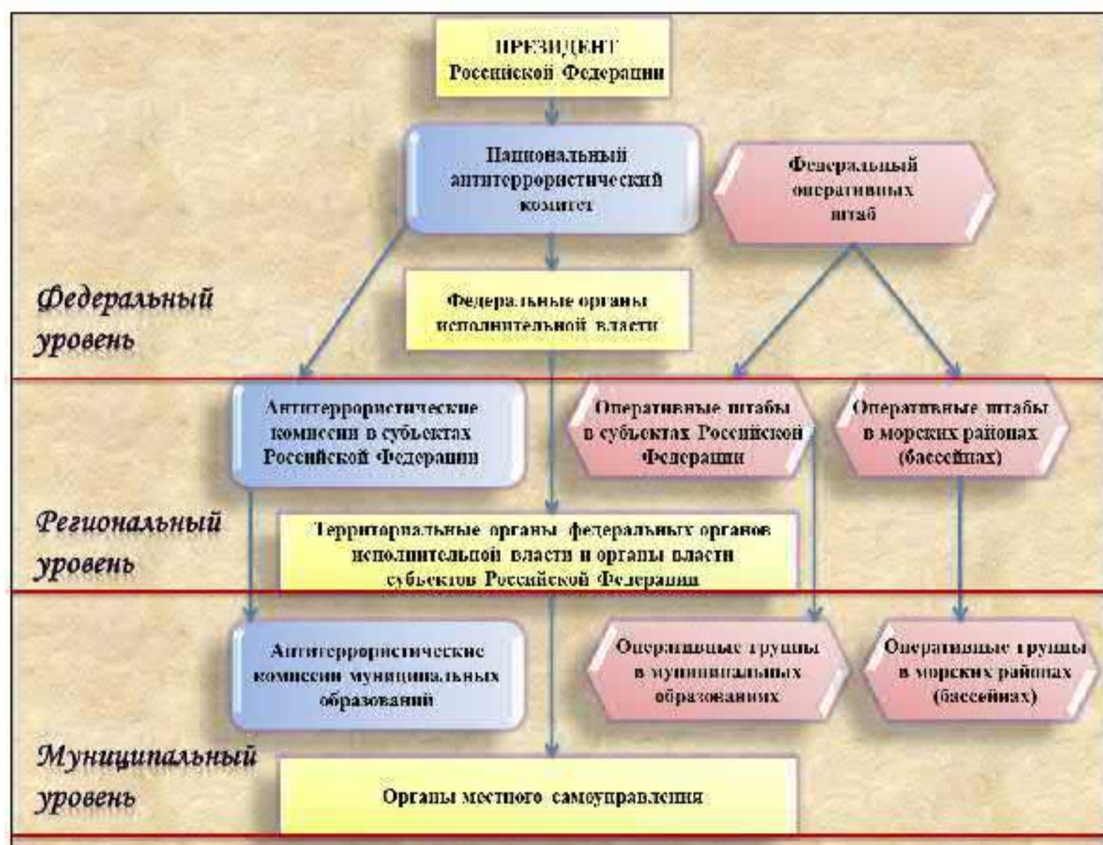
Рис.6. Структура общегосударственной системы противодействия терроризму

осуществляют иные полномочия по решению вопросов местного значения по участию в профилактике терроризма, а также в минимизации и (или) ликвидации последствий его проявлений 1 (рис. 6).