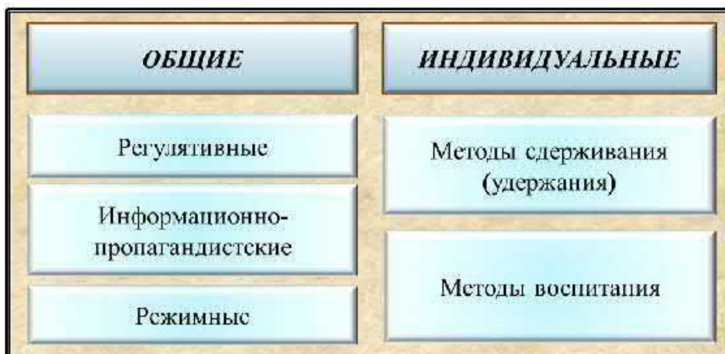
Рис. 12. Методы профилактики терроризма

Методы общей профилактики рассчитаны на оказание предупредительного воздействия на неопределенное множество лиц, на население и его отдельные группы. К данной группе методов относятся: