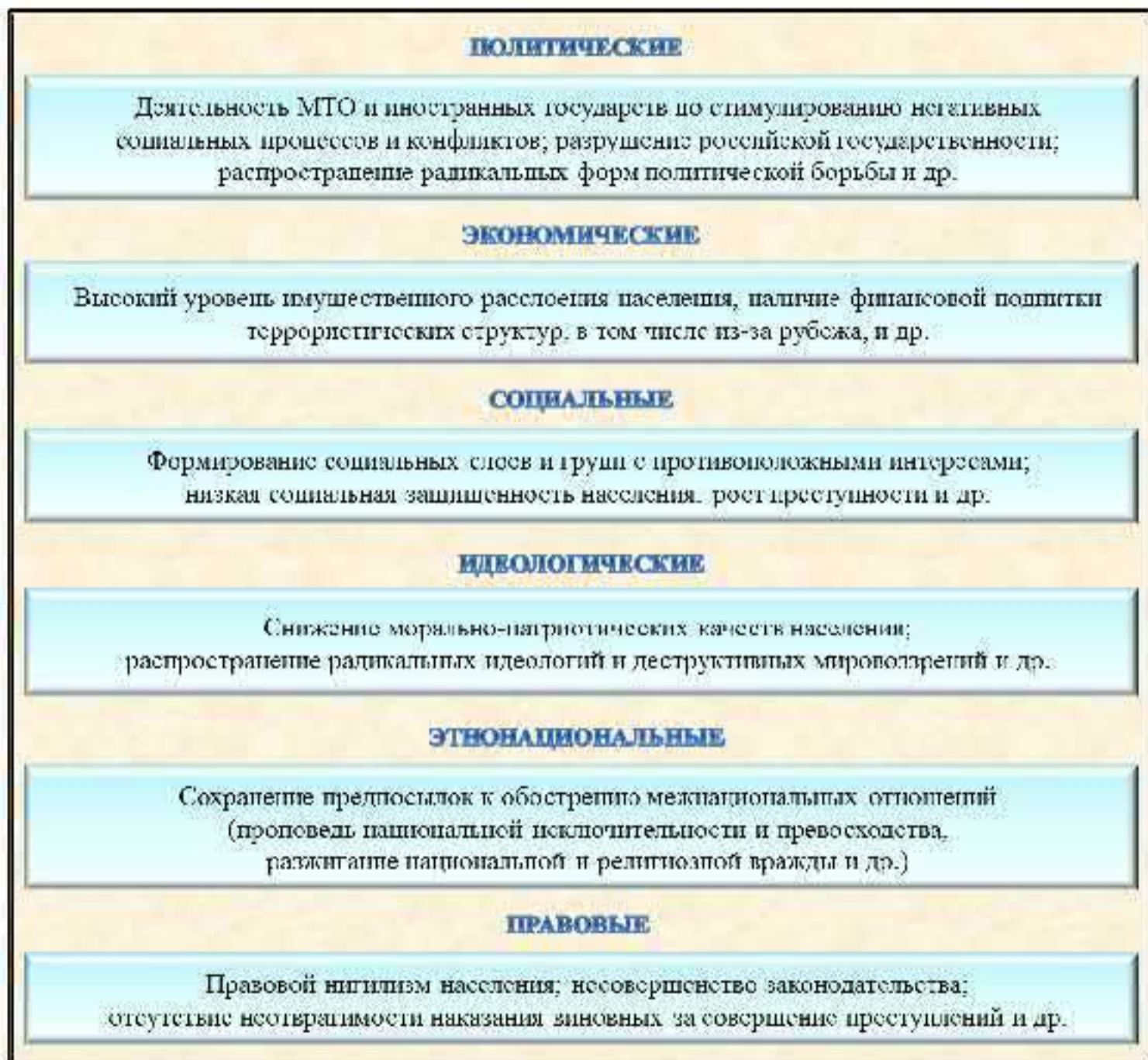
Рис 2. Факторы, способствующие сохранению террористических угроз в Российской Федерации

К правовым факторам относят низкую правовую грамотность населения, отдельных лидеров политических партий, организаций, движений, которая не позволяет адекватно оценить меру своей ответственности за совершаемые действия и их последствия; громоздкость процессуального законодательства; отсутствие эффекта своевременного и строгого наказания виновных за совершение преступных деяний и некоторые другие (рис. 2).