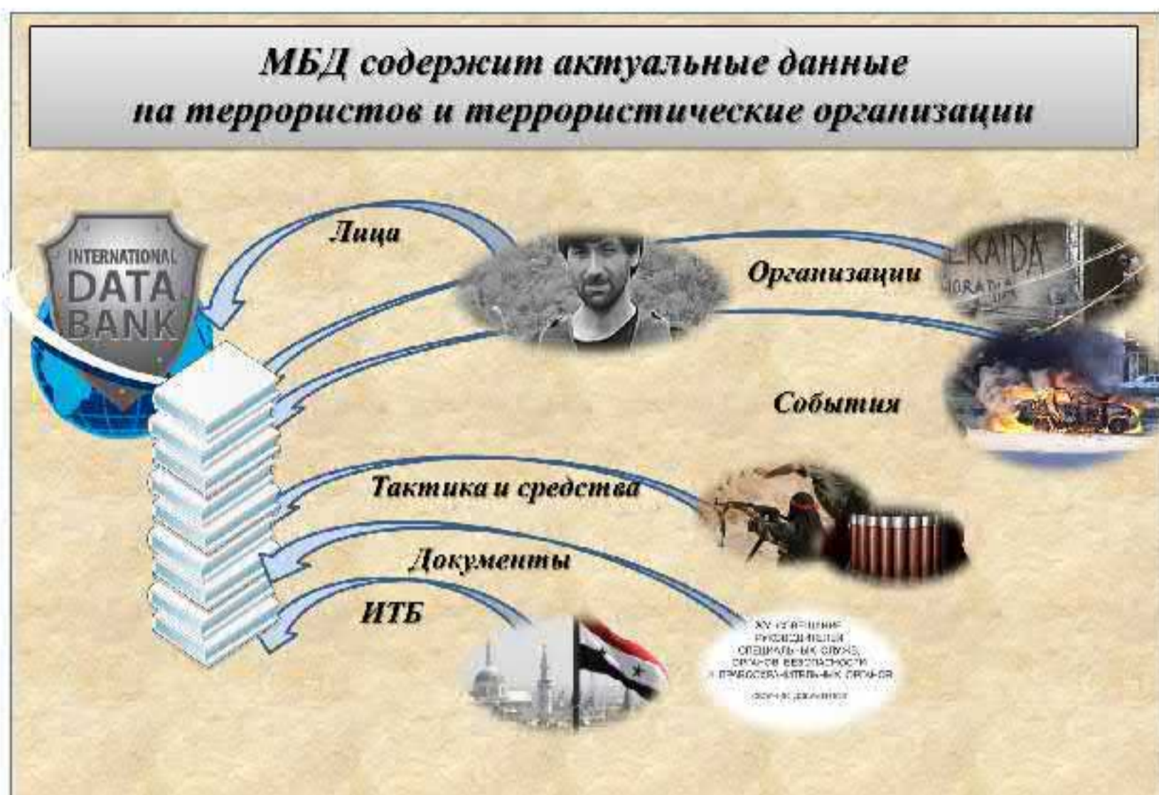
Рис. 10. Структура Международного банка данных по противодействию терроризму

удобном для пользователя виде, в том числе с визуализацией на географической электронной карте, а также в виде графиков и диаграмм. Предусмотрена удобная навигация по разделам банка и возможность создания запросов, позволяющих выявлять связи между различными объектами.