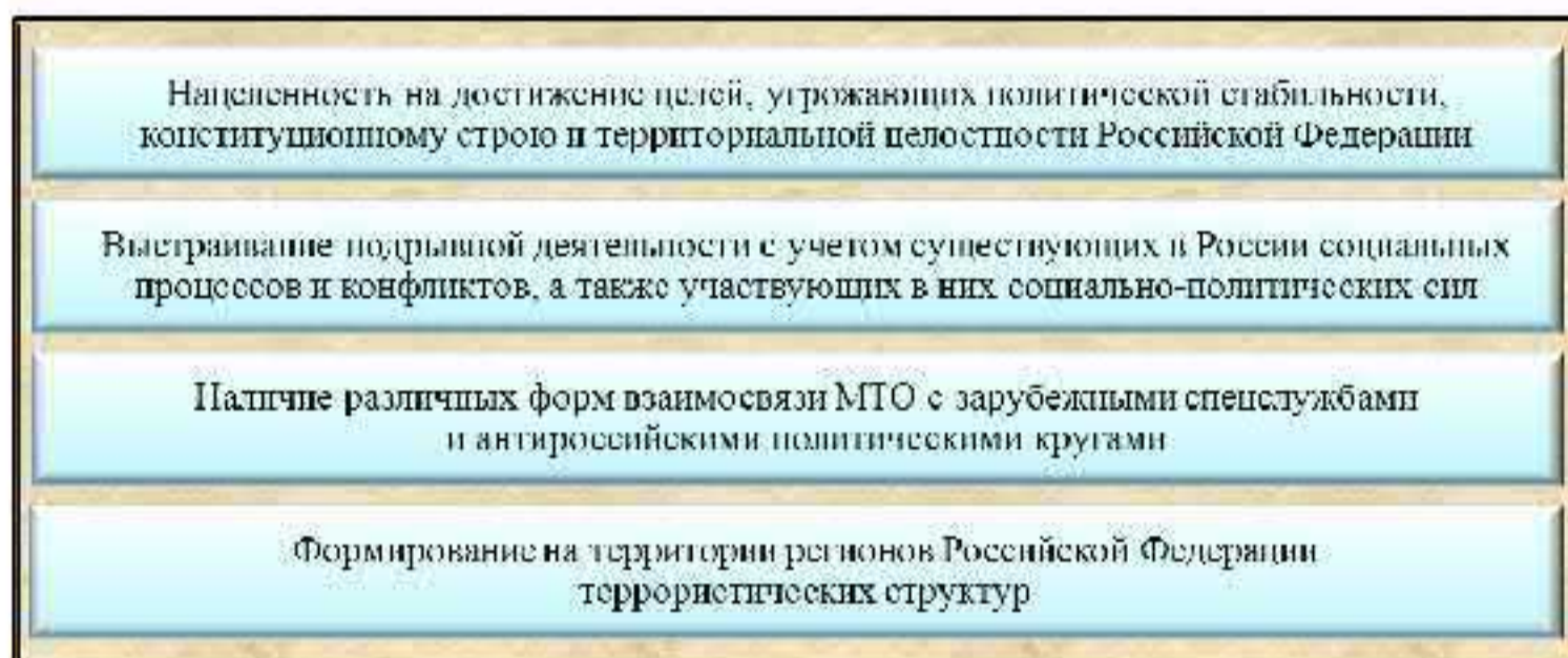
Рис. 1. Особенности деятельности МТО в Российской Федерации на современном этапе

осуществление антироссийской экстремистской пропаганды за рубежом и т. п.