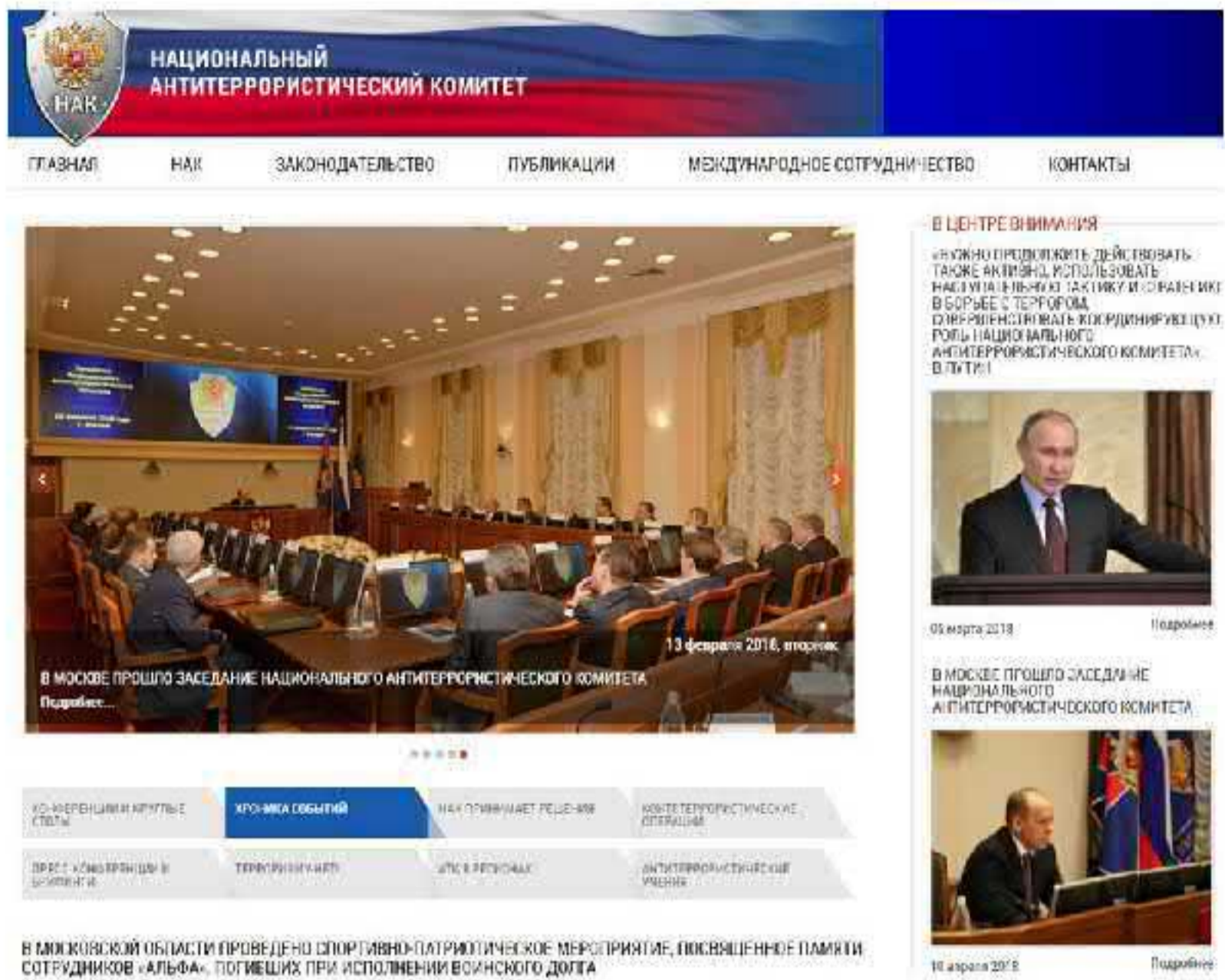
Рис. 8. Официальный сайт Национального антитеррористического комитета

В целях обобщения и распространения положительного опыта по противодействию терроризму аппаратом НАК издаются «Научно-практический бюллетень» и научно-практический журнал «Вестник Национального антитеррористического комитета» (электронная версия последнего доступна на интернет-портале НАК) (рис. 9).