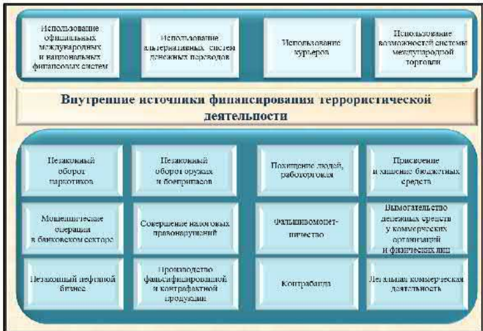
Рис.4. Основные методы и источники поступления финансовой помощи субъектам террористической деятельности на территории России

Кроме того, имеются примеры создания экстремистами и их пособниками легальных коммерческих структур, часть прибыли которых направляется на финансирование террористической деятельности.